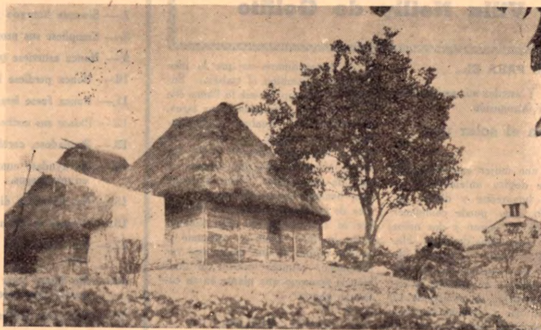
Los típicos ranchos del palenque, enclavados en la montaña profunda donde nuestros indios se refugian lejos del blanco para disfrutar de la relativa independencia a que son tan afectos.

éxito del Colegio Vocacional Agropecuario sean definitivamente una realidad, ya que las circunstancias que han mediado, particularmente en el último paso, aparecen como muy favorables, y estando resueltas ya las dos bases anteriores, no cabe duda que también sea un hecho la tercera. COSTA RICA DE AYER Y HOY, se une al sincero anhelo de todos los costarricenses deseando de corazón que todo se resuelva satisfactoriamente, para bien de la Patria y para satisfacción de quienes, como el padre Sancho, han luchado tesoneramente para este logro de positivo bien social y cultural. Y como todos, esperamos que en Marzo de 1961 el COLEGIO VOCACIONAL AGROPECUARIO sea, en la realidad, una nueva y valiosa conquista de nuestra muy amada Costa Rica.