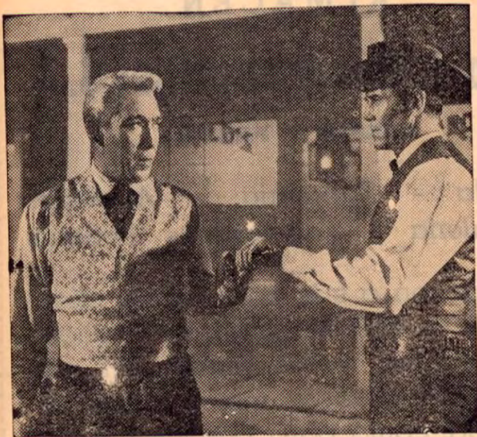
Anthony Quinn y Henry Fonda aparecen en una dramática escena de la impresionante película de acción PUEBLO EMBRUJADO. Es una producción CinemaScope a colores por De Luxe de la 20th Century Fox.

Dos veces ganador del Oscar de la Academia de Hollywood y protagonista de numerosos éxitos artísticos y de taquilla, Anthony Quinn vuelve a su capacidad de actor luego de su debut como director en "El Bucanero".