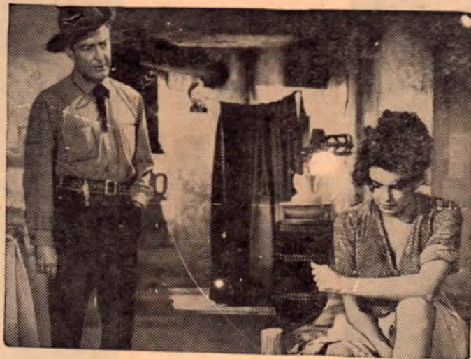
Una escena de la película "El Verdugo" (The Hangman), en que aparece la enigmática y arrebatadora Tina Louise, a quien se refiere este artículo.

Hay veces, sin embargo, que las declaraciones de esta actriz parecen contradictorias. Una vez dijo, por ejemplo, que lo que más le interesa