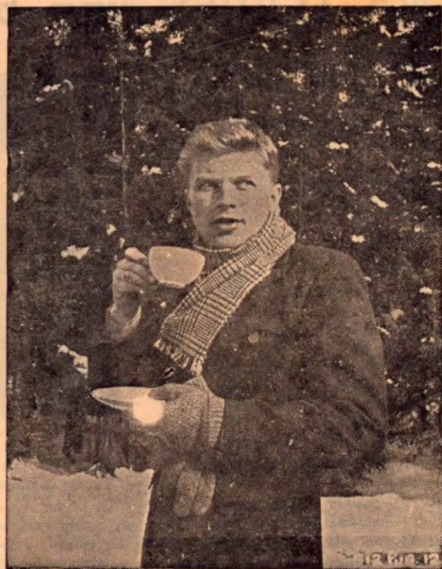
El astro alemán Hardy Kruger adquiere un hábito muy inglés: durante la toma de exteriores para la película EL QUE SE FUE, y a pesar del frío y las incomodidades, siempre hubo tiempo para una taza de té.

El astro del cine británico Peter Finch no anda en muy buenas relaciones con las mujeres australianas. Y también no es para menos: Peter tuvo la franqueza de decir que las mujeres australianas usan los sombreros MAS HORROROS que él haya visto jamás.