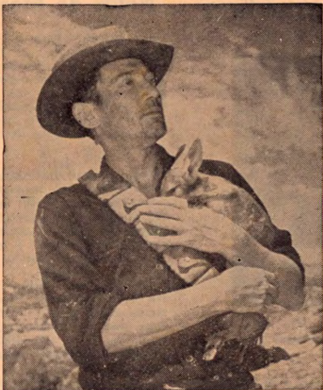
MARGERIE POMMIE y su amigo PETER FINCH luego de finalizar el rodaje de TIERRAS BRAVAS (Robbery under Arms) en el Sur de Australia, se decidió a obsequiar al Jardín Zoológico de Londres, el canguro Margery, pues su madre había sido arrollada por un vehículo perteneciente al equipo de filmación.